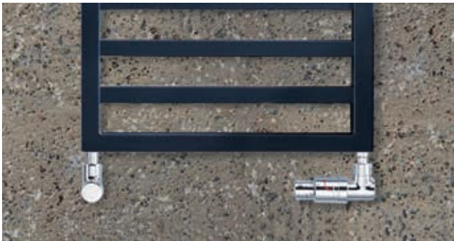
Ausführung Warmwasserbetrieb mit Anschlüssen rechts, links.