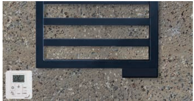
Ausführung Elektrobetrieb inklusive Steuergerät.

H = Bauhöhe, L = Baulänge 1) Norm-Wärmeleistung nach EN 442 2) Gesamthöhe inkl. Heizstab